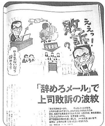
この判決内容は、Yomiuri Weekly [ヨミウリウィークリー] 6月12日号に掲載され、大きな反響をよんでいます。

たとえ上司としての業務上の指導であったとしても、このような陰湿な人格否定の行為は許されるものではありません。従業員はロボットではなく、それぞれが人格を持った人間なのです。